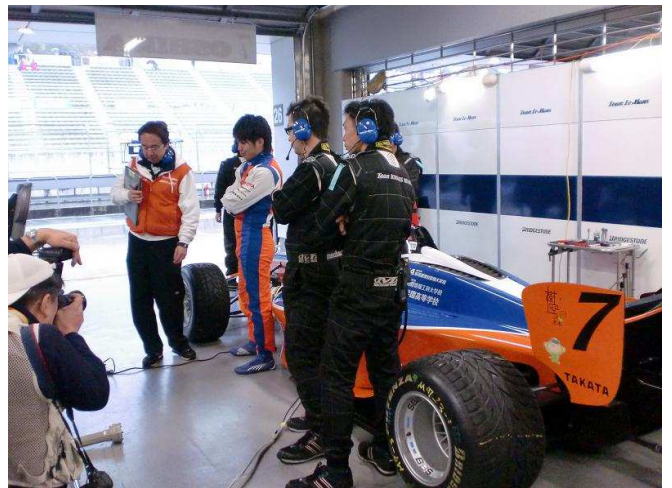
予選で的一幕。他チームの走行をモニターで確認。レーシングスーツがドライバーの大嶋選手。