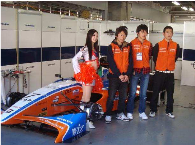
アルビレックスチアリーダーズとアルビレックスレーシングチームユースの3人。