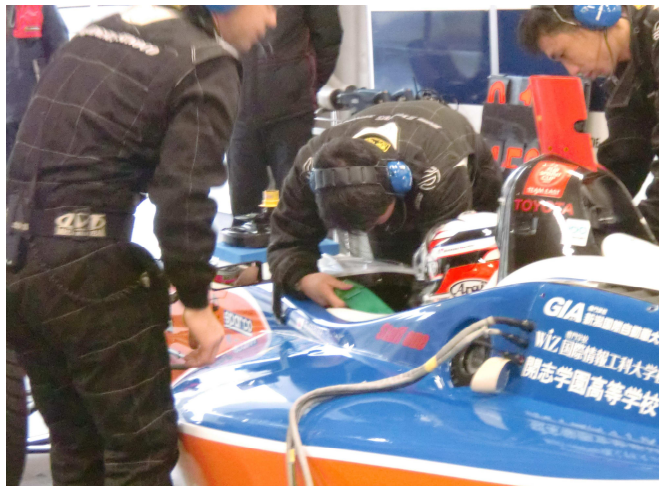
車両に乗り込み、メカニックがシートベルトを装着。